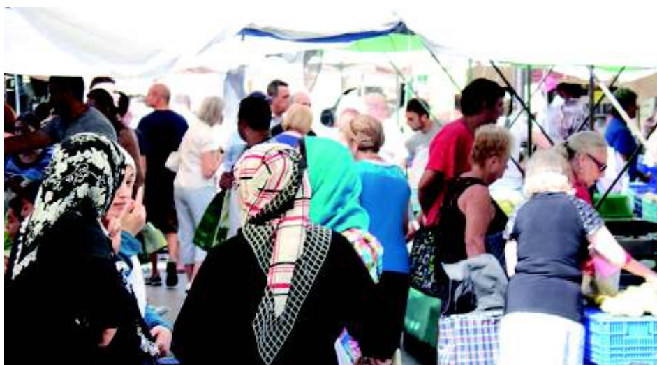
Tot a l'abast de tots