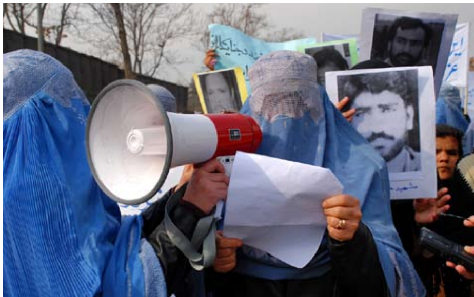
Dones víctimes de guerra manifestant-se als carrers de Kabul demanant justícia

Els matrimonis són sempre preparats per les famílies dels cònjuges, que moltes vegades ni es coneixen abans de casar-se o només s'han vist una o dues vegades. Un estudi realitzat per la Comissió Independent de Drets Humans de l'Afganistan denunciava l'any 2004 que el 38% de les dones asseguraven que s'havien casat en contra de la seva voluntat; així mateix, el 50% declaraven que no estaven contentes amb la seva vida familiar. Segons dades d'UNIFEM corresponents a l'any 2008, entre el 70% i el 80% de les dones de l'Afganistan són forçades a casar-se amb algú que la seva família els ha escollit. De fet, els matrimonis forçats es consideren la principal raó de la violació dels drets de les dones a l'Afganistan.