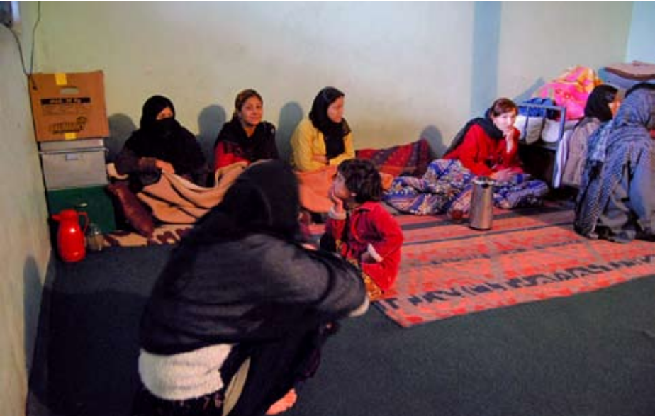
Dones empresonades a la presó de Mazar – e- Sharif, Afganistan