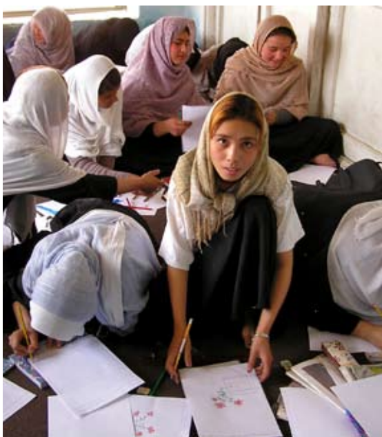
Taller participatiu de dones realitzat l'any 2004 a Kabul per la ONG ASDHA

Ministeri d'Assumptes de la Dona o a una ONG és possible que siguin acceptades en alguna de les cases d'acollida per a dones maltractades que hi ha al país. Els recursos, de moment, són molt escassos. En canvi, les dones que acaben en una comissaria de policia tenen moltes possibilitats d'anar a parar a la presó, ja que solen ser acusades d'adulteri pel fet d'haver fugit de casa i no saber on (i se sobreentén, amb qui) han passat la nit. En definitiva, atesa la violència existent, que és estructural i profundament arrelada a la societat, l'única solució per a les dones seria sortir del país, però això és pràcticament impossible amb les condicions actuals. No es té constància, de moment, de cap dona que hagi intentat refugiar-se en una ambaixada.