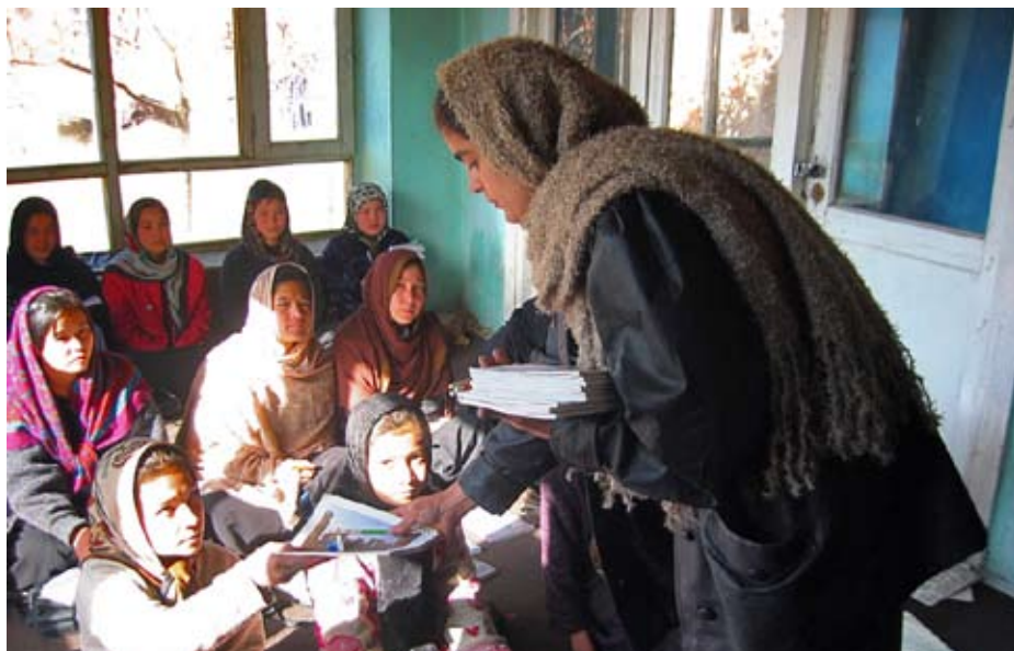
Centre d'alfabetització per a nenes i dones, implementat per l'associació de dones afganeses HAWCA amb el suport d'ASDHA

blíc, la violència contra les dones es materialitza, per una part, en l'amenaça d'antics senyors de la guerra o altres líders militars prominents –que van participar en el conflicte afganès a principis dels anys noranta i encara disposen de les seves pròpies faccions armades– i, per una altra, la del talibà. Aquests han atacat els últims anys nombroses escoles de nenes i han assassinat dones amb càrrecs polítics o les han atacades amb àcid.