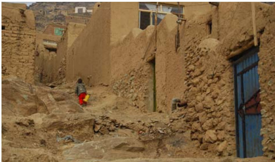
Nen portant aigua a casa seva. Kabul, Afganistan. Novembre 2008

20 d'agost de 2009 Se celebren eleccions presidencials. Hamid Karzai s'alia amb els principals senyors de la guerra del país per aconseguir-ne el suport i guanyar vots a la seva zona d'influència. Alguns dels 38 candidats a les eleccions també van participar en la guerra.