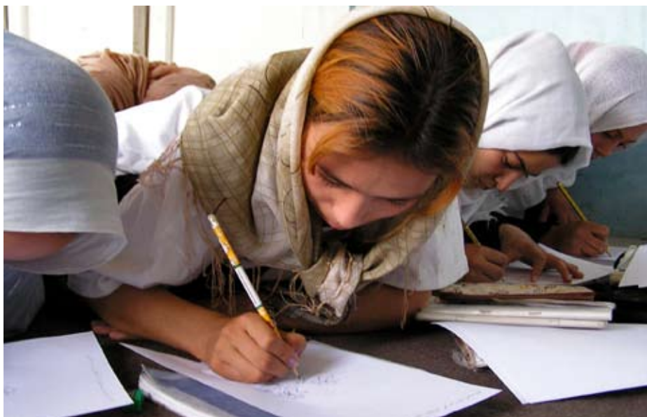
Centre d'alfabetització per a dones, implementat per l'associació de dones afganeses HAWCA amb el suport d'ASDHA

donees que intenten llevar-se la vida cremant-se de viu en viu. Es desconeix per quina raó les dones d'aquesta zona opten per aquesta manera tan brutal de matar-se, però es creu que la proximitat de l'Iran podria tenir-hi algun tipus d'influència, ja que en aquest país també són habituals aquesta mena de suïcidis. La majoria de les dones que ho fan són noies joves –moltes, adolescents– que normalment van ser obligades a casar-se amb un home que no