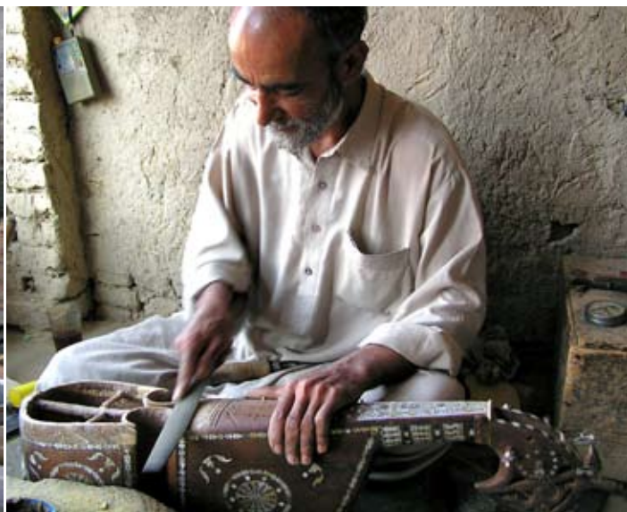
Artesans d'instruments musicals a la ciutat de Kabul.

En aquesta nova Loia Jirga de l'Afganistan, que es va celebrar el juny de 2002, van participar-hi uns 1.500 delegats que van ser escollits per mitjà d'un procediment indirecte supervisat per l'ONU. Aleshores, però, fora de Kabul no hi havia tropes internacionals i les forces de seguretat locals eren escasses o estaven controlades pels senyors de la guerra. El