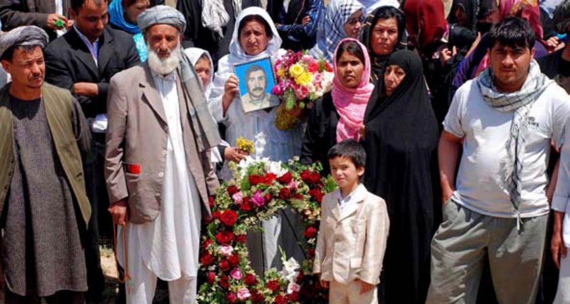
Primera trobada nacional de víctimes de guerra a l'Afganistan. Maig de 2010, Kabul. A la fotografia, un acte en memòria dels desapareguts

quin respectats. A tall d'exemple, existeix la carència d'una legislació que protegeixi la seguretat i les deficiències en el Codi penal, que fan que determinades formes de violència domèstica no puguin ser castigades o que les condemnes siguin especialment lleus. De la mateixa manera, no s'ha dut a terme cap campanya de sensibilització sobre la violència de gènere ni s'ha format el personal funcionari per tractar aquest tema. Les poques cases d'acollida que hi ha al país depenen de les ONG. Ni tan sols existeix una força policial o un sistema formal que s'encarregui d'investigar els casos de violència de gènere a la llar. L'únic rol que juga l'Estat és a través del Ministeri d'Assumptes de la Dona, que acostuma a derivar les dones víctimes de casos extrems de violència a una de les cases d'acollida que hi ha al país i els cerca una sortida legal, res fàcil, d'altra banda. Per exemple, hi ha casos de noies que s'han allistat al cos de policia nacional com a única sortida per disposar d'una certa protecció i poder deixar la casa d'acollida sense haver de tornar amb la seva família.