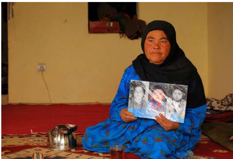
Dona xiïta d'una poble rural a la província de Balk, Afganistan

tradicional, no formal, com a conseqüència d'anys de guerra i de la inexistència d'estructures estatals. Aquest sistema de justícia tradicional difereix d'una província a una altra, però, com a norma general, es tracta d'una jirga o shura (assemblea), formada per líders locals o ancians de la comunitat (sempre homes), que pren decisions basant-se en una combinació de tradicions locals, codis tribals, llei islàmica i la seva pròpia opinió personal.