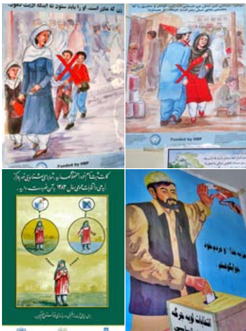
Materials de sensibilització fets per la Xarxa de Dones Afganeses– Afghan Women's Network (AWN)

«Durant l'operació a Afshar [barri de Kabul], les forces [del partit] Ittihad-i-Islami, de Sayyaf, van fer ús de la violació i altres abusos contra civils per fer fora la població d'aquesta zona [...]. La