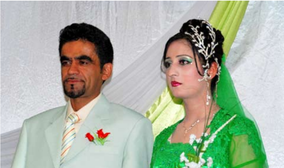
Casament forçat afganès. Kabul, Afganistan, 2007.

més el 38,7% dels electors va votar. Els observadors electorals de la Unió Europea van denunciar que als comicis es va cometre frau massiu.