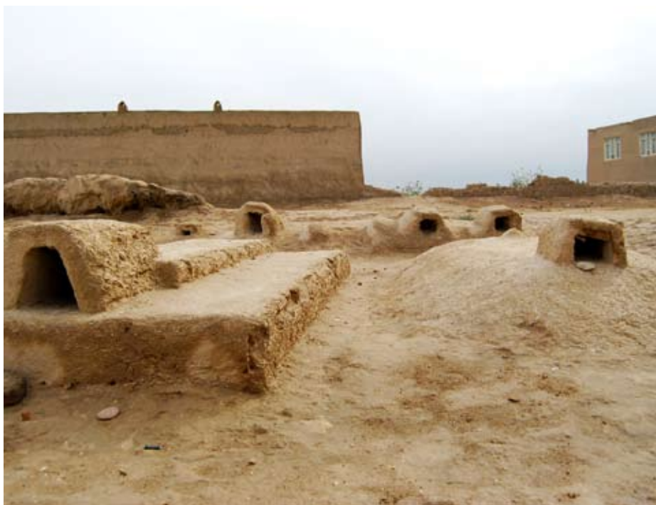
Tombes de víctimes de guerra, assassinades durant l'època dels talibans a Mazar – e – Sharif.

de 16 províncies del país–, destaca que la violència domèstica està totalment normalitzada en la societat afganesa, fins al punt que dones que asseguraven tenir una vida marital satisfactòria, a la vegada també reconeixien ser víctimes d'episodis de violència a mans del seu marit. Segons aquest mateix informe, els índexs de violència més alts en l'àmbit domèstic es donen a les zones de l'Afganistan sota control talibà o amb un entorn social més opressiu per a les dones, mentre que disminueix en aquelles altres amb una presència més gran d'estructures estatals i, sobretot, a les ciutats. Però, sigui el que sigui, subratlla que gairebé la totalitat de les dones són víctimes de violència en l'àmbit domèstic, tant físicament com psicològicament.